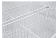
Dividers / Separadores.