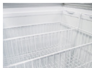
Baskets for ice cream / Canastas para helados preparados.