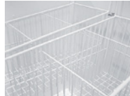
Dividers / Separadores.