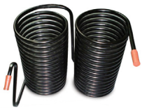
Low maintenance condenser / Condensador de bajo mantenimiento.