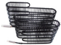
Low maintenance condenser / Condensador de bajo mantenimiento.