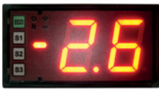
Electronic control / Control electrónico.